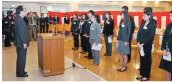
フィリピン就学生決意表明

フィリピンからの介護福祉士候補者就学コースの17名は、半年間の日本語研修を終了し、3月20日、健祥