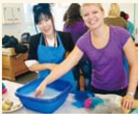
ドイツ作業療法士養成校

海外旅行がはじめての学生がほとんどで、旅のはじめは緊張と不安を感じていました。しかし、どの学生も日本とヨーロッパの違いを自分の肌で直接感じることで、あっというまに目に輝きが宿り、新しい刺激を楽しみながらどんどん成長していきました。帰国時には、すべての学生がひとまわり大きく感じられました。この海外研修旅行で経験した国際感覚が、これからの学生の将来にきっと役立つときがくるでしょう。