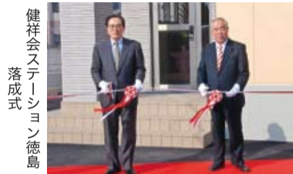
健祥会ステーション徳島落成式

会ステーション徳島に入寮しました。今春から本校に入學し、日本人の学生と一緒に介護福祉士をめざします。彼らが介護の授業を十分に理解できるように、日本語の授業も行います。振り仮名付の教材を使用し、専門用語も日本語の授業で学びながら、当面の目標として日本語能力試験2級をめざします。その後は介護福祉士養成施設協会の卒業時共通試験の合格を目標に学習を続けることとなります。また、健祥会グループの各施設の就学コースの介護福祉士候補者については、1週間に1回、日本語教師が施設での巡回授業を行っています。